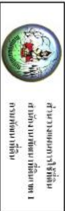
รูปที่ 3-1 แผนที่ราชการจัดพื้นที่ราชการ อำเภอป่าหนาด จังหวัดน่าน