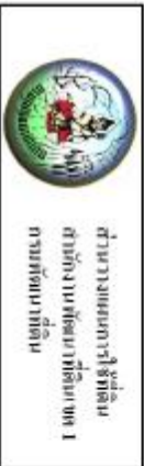
รูปที่ 3-1 แผนที่ราชการที่ดิน ตำบลตะโพก อำเภอบ้านหมี่ จังหวัดนครราชสีมา