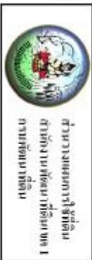
รูปที่ 3-1 แผนที่ราชทานที่ดิน ตำบลชุมพล อำเภอองครักษ์ จังหวัดนครนายก