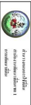
รูปที่ 3-1 แผนที่ชุมชนท้องถิ่น ตำบลรัฐฯ อำเภอเมืองนครพนม จังหวัดนครพนม