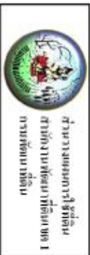
รูปที่ 3-1 แผนผังรายละเอียด ตำบลท่าทราย อำเภอเมืองนครนายก จังหวัดนครนายก