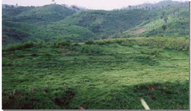
บริเวณที่พบ

ลักษณะโดยทั่วไป : ดินนี้มีการผสมของดินหลายชนิด ซึ่งเกิดจากตะกอนลำนํ้าพัดพามาทับถมบริเวณสันดินริมน้ำ บริเวณพื้นที่เนินตะกอนซึ่งส่วนใหญ่ มีสภาพพื้นที่ค่อนข้างราบเรียบ จนถึงลูกคลื่นลอนลาดมีความลาดชันประมาณ 2 - 12 % โดยทั่ว ๆ ไปดินกลุ่มนี้มีการระบายน้ำดีถึงดีปานกลาง ส่วนใหญ่เป็นดินลึก เนื้อดินเป็นพวกดินร่วน บางแห่งมีชั้นดินที่มีเนื้อดินค่อนข้างเป็นทรายหรือมีชั้นกรวด ซึ่งแสดงถึงการตกตะกอนต่างยุคของดินอื่น เป็นผลมาจากการเกิดน้ำท่วมใหญ่ในอดีต ดินกลุ่มนี้โดยทั่ว ๆ ไปมีความอุดมสมบูรณ์ปานกลาง และปฏิกิริยาดินเป็นกรดปานกลางถึงเป็นกลาง ได้แก่ชุดดินดินตะกอนลำนํ้าที่มีการระบายน้ำดี (AL-W) ปัจจุบันดินนี้มีการใช้ประโยชน์ที่ดินค่อนข้างกว้างขวาง นิยมปลูกพืชผัก พืชไร่ ไม้ผลและไม้ยืนต้น