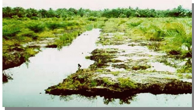
บริเวณที่พบ

ลักษณะโดยทั่วไป : หน่วยที่ดินนี้เป็นกลุ่มชุดดิน ที่มีลักษณะคล้ายคลึงกับกลุ่มชุดดินที่ 57 กล่าวคือเป็นดินอินทรีย์ในพื้นที่พรุ แต่ชั้นดินอินทรีย์ที่พบหนากว่า 100 ซม. และมีเนื้อหยาบกว่าอีกทั้งมีเศษพืชขนาดเล็กและขนาดใหญ่ปะปนอยู่ทั่วไป ปัจจุบันบริเวณดังกล่าวส่วนใหญ่ยังคงสภาพป่าพรุ บริเวณขอบ ๆ พรุบางแห่งใช้ปลูกพืชล้มลุกและพืชผักสวนครัว แต่ไม่ค่อยได้ผล เมื่อป่าพรุถูกทำลายไปจะมีพืชต่าง ๆ เช่น กระจูด เพริน และเสม็ดขึ้นแทนที่ ตัวอย่างชุดดินที่อยู่ในกลุ่มนี้ได้แก่ ชุดดินนราธิวาส