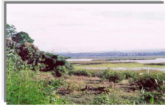
บริเวณที่พบ

ลักษณะโดยทั่วไป : เนื้อดินเป็นพวกดินเหนียว ดินบนมีสีเทาแก่ น้ำตาลปนเทา ดินล่างมีสีเทาอ่อนหรือสีเทา มีจุดประสีน้ำตาลแก่และน้ำตาลปนเหลือง ตลอดชั้นดินมักพบก้อนสารเคมี เหล็กและแมงกานีสปะปนอยู่ในพื้นที่ปลูกของไม้ผลแต่ละชนิดชั้นดินลึกดินกลุ่มดินนี้ เกิดจากพวกตะกอนลำนํ้า และเป็นดินลึก มีการระบายน้ำแลวพบในพื้นที่ ราบเรียบตามลานตะพักลำนํ้าค่อนข้างใหม่ และลานตะพักลำนํ้าระดับต่ำ น้ำแข็งลึกลงน้อยกว่า 30 ซม. นาน 3-5 เดือน ดินมีความอุดมสมบูรณ์ตามธรรมชาติค่อนข้างต่ำถึงปานกลาง pH 5.5-6.5 แต่ถ้าดินมีก้อนปูนปะปนในดินชั้นล่าง ดินชั้นนี้จะมีปฏิกิริยาเป็นด่างอ่อน pH 7.5-8.0 ได้แก่ ชุดดินหางดง และ พาน ปัจจุบันบริเวณดังกล่าวส่วนใหญ่ใช้ทำนา ในบริเวณที่มีแหล่งน้ำใช้ปลูกพืชไร่ พืชผัก และยาสูบในช่วงฤดูแล้ง ข้าวที่ปลูกโดยมากให้ผลผลิตค่อนข้างสูง