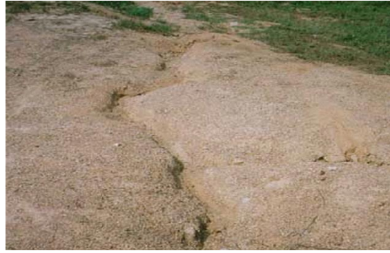
บริเวณที่พบ

ลักษณะโดยทั่วไป : เนื้อดินบนส่วนใหญ่เป็นดินร่วนปนทราย ส่วนดินล่างเป็นดินร่วนเหนียวปนเศษหินหรือปนกรวด ก้อนกรวดขนาดใหญ่เป็นหินกลมมน ถ้าเป็นดินปนเศษหินมักพบชั้นหินพื้นดิน > 50 ซม. ดินเป็นสีน้ำตาล สีน้ำตาลปนแดง สีแดงปนเหลือง พบบริเวณพื้นที่เป็นลูกคลื่นลอนลาดถึงเนินเขา มีความลาดชันประมาณ 3 - 25 % เป็นดินตื้นมาก มีความอุดมสมบูรณ์ตามธรรมชาติต่ำ ระดับน้ำใต้ดินอยู่ลึกกว่า 2 เมตรตลอดปี pH 5.0-7.0 ได้แก่ชุดดินท่ายาง แมริม นาเจียง พะเยา น้ำขุ่น ปัจจุบันบริเวณดังกล่าวเป็นป่าเบญจพรรณ ป่าเต็งรัง ป่าละเมาะ และทุ่งหญ้าธรรมชาติ บางแห่งใช้ปลูกพืชไร่ หรือไม้โตเร็ว