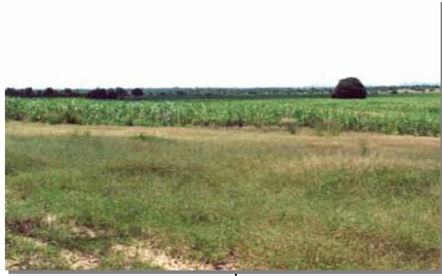
บริเวณที่พบ

ลักษณะโดยทั่วไป : เนื้อดินเป็นพวกดินทราย สีเทาหรือสีน้ำตาลอ่อน เกิดจากวัตถุต้นกำเนิดดินพวกตะกอนลำนํ้า หรือเกิดจากการสลายตัวผุพังของหินเนื้อหยาบ พบบริเวณพื้นที่ดินที่มีลักษณะเป็นลูกคลื่นจนถึงเชิงเขา มีความลาดชันประมาณ 3 - 20 % เป็นดินลึก มีการระบายน้ำดีมากเกินไป มีความอุดมสมบูรณ์ตามธรรมชาติต่ำมาก pH 5.5-7.0 ได้แก่ชุดดินน้ำพอง และจันทึก ปัจจุบันบริเวณดังกล่าวใช้ปลูกพืชไร่ต่าง ๆ เช่น มันสำปะหลัง อ้อย สับปะรด ปอ ส่วนไม้ยืนต้นได้แก่ มะพร้าว มะม่วงหิมพานต์ บางแห่งเป็นป่าเต็งรัง หรือทุ่งหญ้าธรรมชาติ