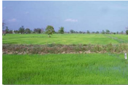
บริเวณที่พบ

ลักษณะโดยทั่วไป : เนื้อดินเป็นพวกดินเหนียว ดินบนมีสีน้ำตาลปนเทาหรือสีน้ำตาล ดินล่างมีสีน้ำตาลปนเทา หรือสีน้ำตาล หรือสีเทาปนสีเขียวมะกอกมีจุดประสีน้ำตาลปนเหลืองหรือสีน้ำตาลแก่ อาจพบก้อนปูน ก้อนสารเคมีสะสมพวกเหล็ก และแมงกานีสในชั้นดินล่าง การระบายน้ำค่อนข้างเร็วถึงเร็ว พบตามที่ราบเรียบหรือที่ราบลุ่มระหว่างคันดินริมลำน้ำ กับลานตะพักลำน้ำค่อนข้างใหม่ น้ำแช่ขัง ในฤดูฝนลึก 30 - 50 ซม. นาน 4-5 เดือน ดินมีความอุดมสมบูรณ์ตามธรรมชาติปานกลาง pH 5.5-6.5 ถ้าหากดินมีก้อนปูนปะปนอยู่ pH จะเป็น 7.0-8.0 ได้แก่ ชุดดินชัยนาท ราชบุรี ท่าพล และสระบุรี, บางมูลนาก ปัจจุบันบริเวณดังกล่าวส่วนใหญ่ใช้ทำนา บางแห่งยกทรงเพื่อปลูกพืชผักหรือไม้ผล ซึ่งมักจะให้ผลผลิตค่อนข้างสูง