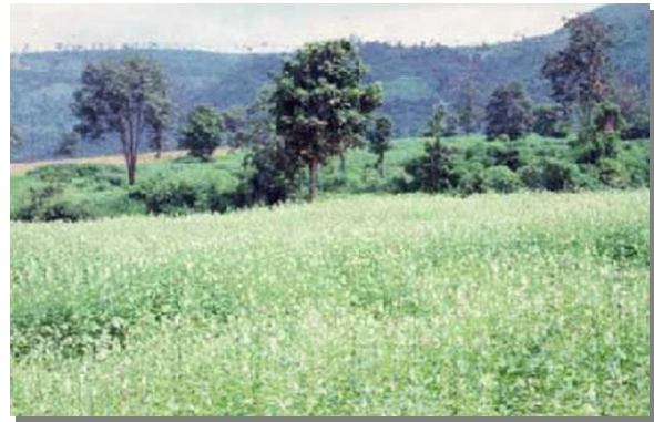
บริเวณที่พบ

ลักษณะโดยทั่วไป : เนื้อดินเป็นดินร่วนปนทราย ส่วนดินล่างเป็นดินร่วนเหนียวปนทราย สีน้ำตาล สีเหลือง หรือสีแดง เกิดจากวัตถุต้นกำเนิดดินพวกตะกอนลำน้ำ หรือเกิดจากการสลายตัวของหินเนื้อหยาบ พบบริเวณพื้นที่ดินที่มีลักษณะเป็นลูกคลื่นจนถึงที่ลาดเชิงเขา ส่วนใหญ่มีความลาดชันประมาณ 3 - 20 % และบางส่วนมีความลาดชันประมาณ 20 - 35 % เป็นดินลึก มีการระบายน้ำดี ระดับน้ำใต้ดินอยู่ลึกกว่า 1.50 เมตรตลอดปี มีความอุดมสมบูรณ์ตามธรรมชาติค่า pH ประมาณ 4.5 - 5.5 ได้แก่ ชุดดินคอนไร่ โคราช สะตึก วาริน ยโสธร และด่านซ้าย มาบบอน ปัจจุบันบริเวณดังกล่าวใช้ปลูกพืชไร่ต่าง ๆ เช่น มันสำปะหลัง ข้าวโพด ข้าวฟ่าง อ้อย ปอ งา และถั่ว บางแห่งใช้ปลูกไม้ผลและไม่ขึ้นต้นบางชนิด