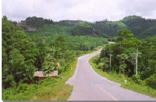
บริเวณที่พบ

ลักษณะโดยทั่วไป : หน่วยที่ดินเป็นกลุ่มชุดดินที่มีเนื้อดินเป็นพวกดินร่วนปนทราย พบในเขตฝนตกชุก เช่น ภาคใต้ดินเป็นสีน้ำตาล สีเหลืองหรือสีแดง เกิดจากวัตถุต้นกำเนิดดินพวกตะกอนลำนํ้า หรือเกิดจากการสลายตัวของหินเนื้อหยาบ เป็นดินลึกมาก มีการระบายน้ำดีถึงปานกลาง มีความอุดมสมบูรณ์ตามธรรมชาติต่ำ ปฏิกิริยาดินเป็นกรดจัดถึงเป็นกรดแก่ มีค่าความเป็นกรดเป็นด่างประมาณ 4.5-5.5 ปัจจุบันบริเวณดังกล่าวใช้ปลูกยางพารา มะพร้าว ไม้ผลต่าง ๆ และพืชไร่บางชนิดบางแห่งยังคงสภาพป่าธรรมชาติ ป่าละเมาะและไม้พุ่ม