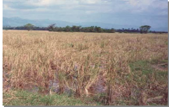
บริเวณที่พบ

ลักษณะโดยทั่วไป : เนื้อดินเป็นพวกดินทราย บางแห่งมีเปลือกหอยปะปนอยู่ในดินชั้นล่าง สีดินเป็นสีเทา พบจุดประสีน้ำตาลหรือสีเหลืองปะปนอยู่ในดินชั้นล่างเกิดจากวัตถุต้นกำเนิดดินพวกตะกอนน้ำทะเล พบในบริเวณที่ลุ่มระหว่างสันหาด หรือเนินทรายชายฝั่งทะเล น้ำแข็งลึก 30-50 ซม. นาน 4 - 5 เดือน เป็นดินลึก มีการระบายน้ำเลวถึงเลวมาก มีความอุดมสมบูรณ์ตามธรรมชาติต่ำ pH ประมาณ 6.0-7.0 แต่ถ้ามีเปลือกหอยปะปนอยู่ pH จะอยู่ 7.5-8.5 ได้แก่ชุดดินวังเปรียง และบางละมุง