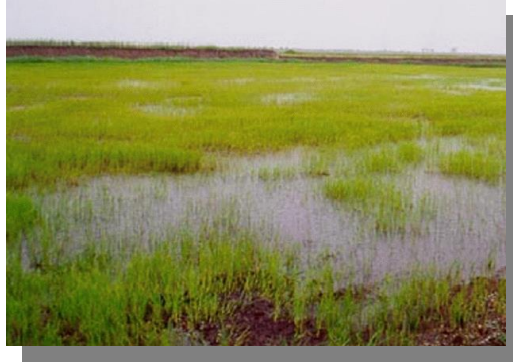
บริเวณที่พบ

ลักษณะโดยทั่วไป : เนื้อดินเป็นดินเหนียว ดินบนมีสีเทาหรือเทาแก่ ดินล่างมีสีเทา จุดประสีน้ำตาลและสีเหลืองหรือสีแดง พบตามที่ราบลุ่มภาคกลางเป็นส่วนใหญ่ มีน้ำแช่ขังลึก 20-50 ซม. นาน 3-5 เดือน ถ้าเป็นดินที่ได้รับอิทธิพลจากน้ำทะเลจะพบสารจาโรไซต์สีเหลืองฝังในระดับความลึกเป็นดิน ลึก มีการระบายน้ำเร็ว ความอุดมสมบูรณ์ตามธรรมชาติปานกลาง pH 4.5-5.5 ได้แก่ ชุดดินอยุธยา บางเขน บางน้ำเปรี้ยว ท่าขวาง ชุมแสง บางปะอิน และมหาโพธิ์