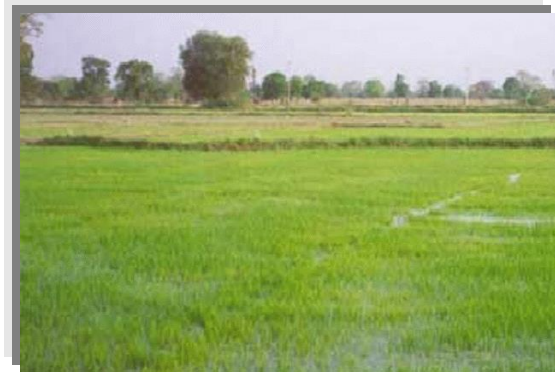
บริเวณที่พบ

ลักษณะโดยทั่วไป : เนื้อดินบนเป็นดินร่วนปนทราย สีเทาปนน้ำตาลอ่อน, สีน้ำตาลปนแดงอ่อน ดินล่างเป็นดินร่วนเหนียวปนทราย สีเทาปนน้ำตาล, สีเทาปนชมพู พบจุดประสีน้ำตาลแก่ สีแดงปนเหลืองปะปน เกิดจากพวกตะกอนลำน้ำพบบริเวณ พื้นที่ราบเรียบหรือค่อนข้างราบเรียบตามลานตะพักลำน้ำระดับต่ำ น้ำแช่ขังลึก 30 ซม. นานประมาณ 4 เดือน เป็นดินลึก มีการระบายน้ำค่อนข้างเร็ว มีความอุดมสมบูรณ์ตามธรรมชาติค่อนข้างต่ำ ดินชั้นบน pH 6.0-7.0 ส่วนดินชั้นล่าง pH ประมาณ 5.5-6.5 ได้แก่ชุดดินเขาย้อย ชลบุรี และโคกสำโรง ปัจจุบันบริเวณดังกล่าวส่วนใหญ่ใช้ทำนา บางแห่งใช้ปลูกอ้อย หรือปลูกพืชล้มลุกในฤดูแล้ง