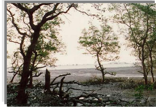
บริเวณที่พบ

ลักษณะโดยทั่วไป : ดินนี้มีลักษณะดิน สภาพแวดล้อม และการใช้ประโยชน์ที่ดินคล้ายคลึงกับกลุ่มดินที่ 12 แต่เป็นดินที่มีสารประกอบกำมะถันปะปนอยู่มาก ตามปกติเมื่อเปียกดินจะเป็นกลางหรือเป็นด่างแต่เมื่อมีการระบายน้ำออกไปหรือทำให้ดินแห้งสารประกอบกำมะถันจะแปรสภาพปล่อยกรดกำมะถันออกมา ทำให้ดินเป็นกรดจัดมาก การจัดการที่ดินจึงยุ่งยากขึ้นเป็นพวิภูณดินกลุ่มนี้จัดเป็นดินเค็มที่มีกรดแฝงอยู่ ได้แก่ ชุดดินบางประกง ชุดดินตะกั่วทุ่ง ปกติบริเวณที่พบเหล่านี้ มักมีป่าชายเลนขึ้นปกคลุม ปัจจุบันมีพื้นที่จำนวนมากที่ตัดแปลงมาใช้ทำนา กุ้ง เลี้ยงปลา หรือทำนาเกลือ การทำนากุ้ง ถ้าไม่มีการจัดการที่เหมาะสมผลผลิตมักลดลงอย่างรวดเร็ว เนื่องจากการเกิดกรดและการเกิดสารพิษบางชนิด เช่น ก๊าซไข่เน่า