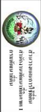
รูปที่ 3-1 แผนที่ชั้นข้อมูลที่ดิน ตำบลนา อำเภอวังจันทน์ จังหวัดสกลนคร